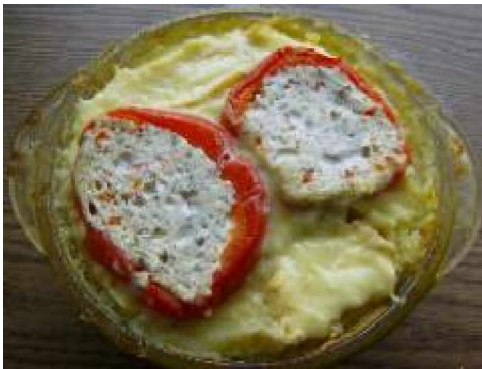
gebacken mit Deckel

1 Pfund Pellkartoffeln 0,5 TI Kümmel Butter Salz Muskatnuss frisch gerieben